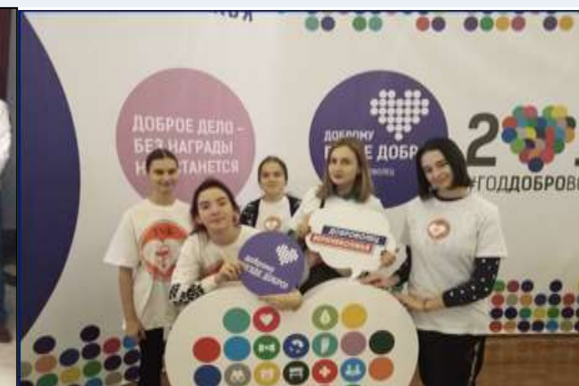
Всероссийское мероприятие Форум «Волонтеры-медики»