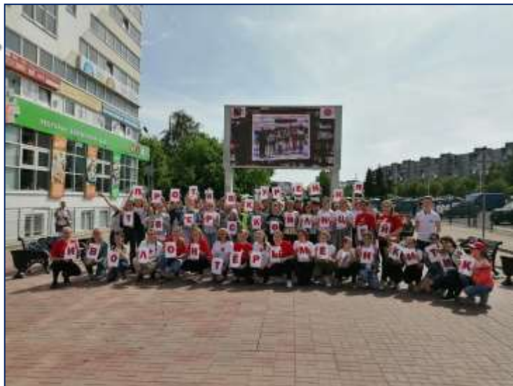
День борьбы против курения