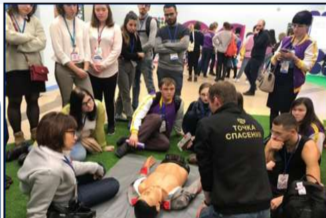
Всероссийский проект «Доброволец Года» в Кремле

Всероссийское общественное движение «Волонтеры- медики»